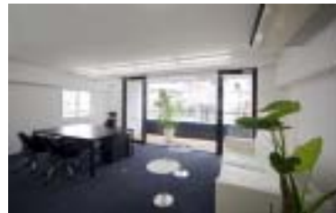
B-Type 7F 20.78坪 (家具配置例)

所在地: 東京都渋谷区道玄坂 1-18-1 構造規模: 鉄筋コンクリート造 地上8階 地下1階 竣工年: 2006年3月